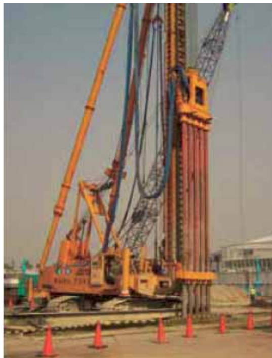
図4 SMW工法の様子