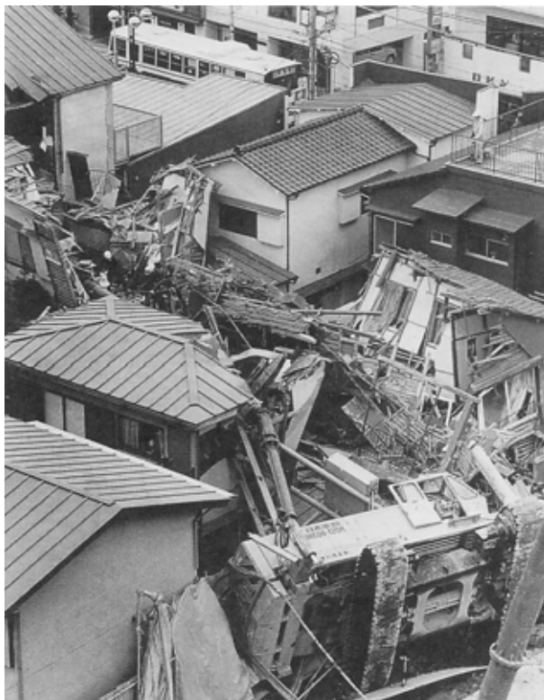
図1 現場の様子

1991年3月16日午前9時半すぎ、東京都立川市曙町1丁目の大成建設と五洋建設のジョイントベンチャーによる立川JFビル新築工事現場で、大きな音とともに土止め用の大型杭打ち機（重さ約100トン、高さ約30m）が東側に倒れた。下敷きになった民家や木造アパート2棟が全壊、2棟が半壊、3棟の一部が壊れた。この事故でアパートの中にいた大学生2名が死亡した。工事作業員に怪我人は出なかった（図1）。