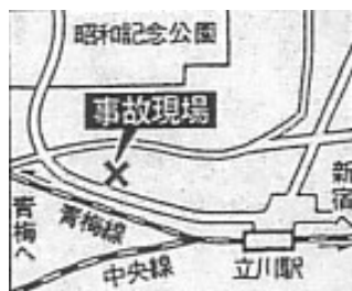
図2 現場地図

現場はJR立川駅近くの住宅密集地であった。杭打ち作業が行われていたのは、大成建設と五洋建設の共同企業が請け負った「立川」Fビル（7階建て）新築工事現場（図2）。1990年11月に着工し、1992年3月完成予定だった。現場の土止め事故は基礎工事専門の成幸工業（本社大阪）が請け負い、杭打ちは同社からさらに丸德基業（本社仙台）が孫請けしていた。